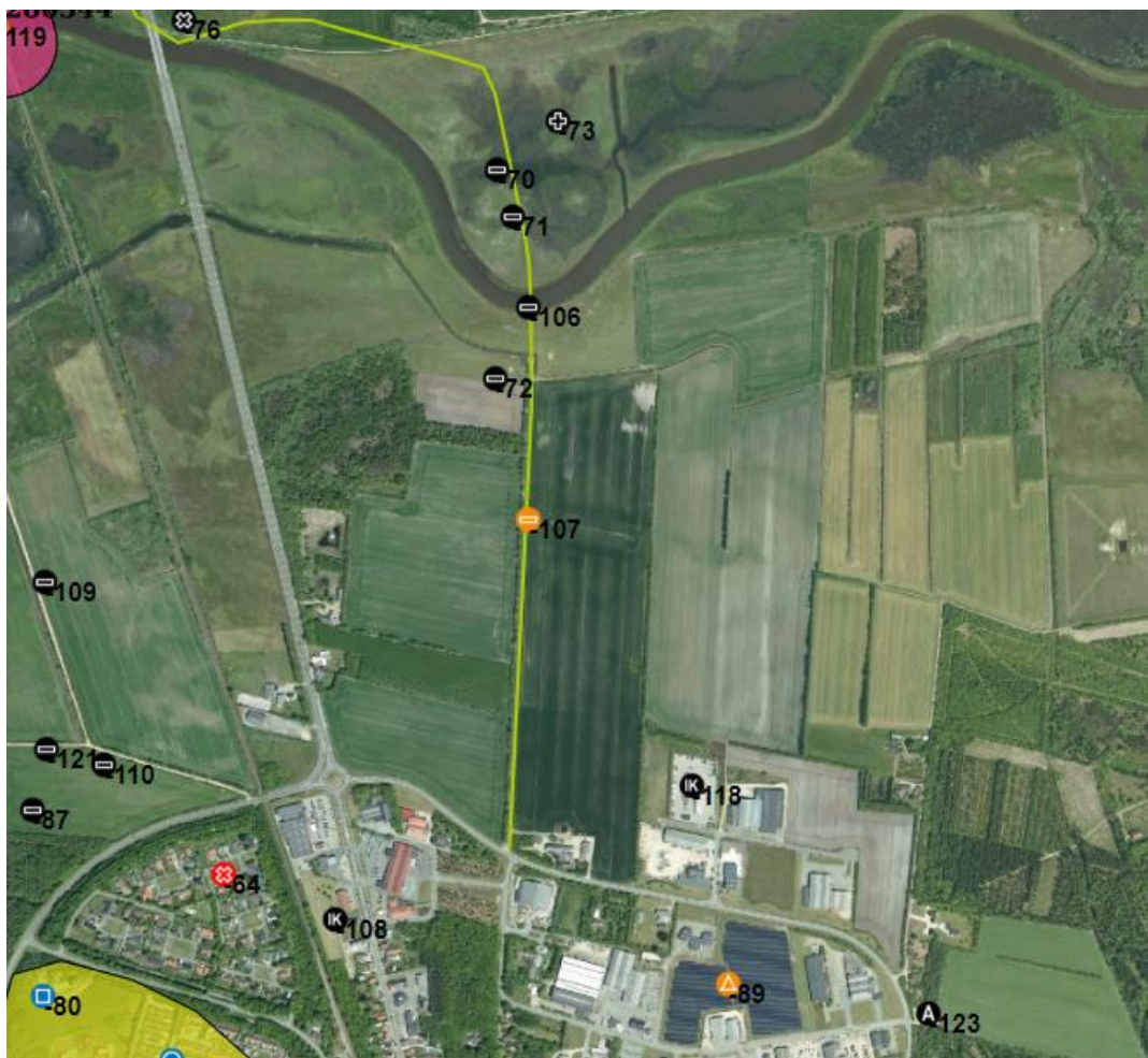
Fig. 2. Kort Fund og Fortidsminder, rækken af sorte prikker over Skjern å viser fund af bro og vejrspor.

Arkæologi Vestjylland har foretaget en arkivalsk kontrol af det område hvor erhvervsområdet ønskes etableret. Det ansøgte areal befinder sig inden for et område, hvor museet ikke uden en forudgående forundersøgelse kan udtale sig om, hvorvidt der er fortidsminder og deres væsentlighed. Det er dog meget sandsynligt, at der er fortidsminder på området, da der her ligger et gammelt overfartssted over Skjern å. Der er derfor en sandsynlighed for, at man i forbindelse med anlægsarbejdet vil berøre væsentlige fortidsminder i form af veje eller bopladser, som ifølge museumsloven skal undersøges.