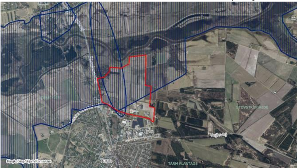
Fig. 1. Oversigtskort kort. Ringkøbing-Skjern Kommune Blå Streg: Kulturmiljøer Rød Streg: Muligt erhvervsområde.

Arkæologi Vestjylland har primært forholdt sig til spørgsmålet om der i forbindelse med et evt. anlægsarbejde er risiko for at forstyrre jordfaste fortidsminder. Med hensyn til de udpegende kulturmiljøere henvises dertil Team Nyere tid på Ringkøbing- Skjern Museum - din henvendelse og vores svar er videresendt til dem, så de kan svare direkte hvis de har yderligere bemærkninger.