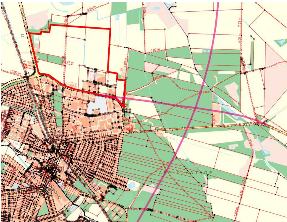
Figur 1. Planområde og vejplanlinjer for omfartsvej nord om Tarm

Vi forudsætter, at byggelinjearealet i den videre planlægning friholdes for bygninger og andre faste anlæg.